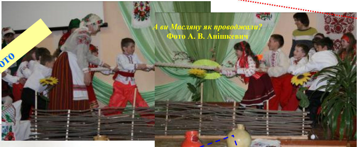
А ви Мисляну як проводжали?