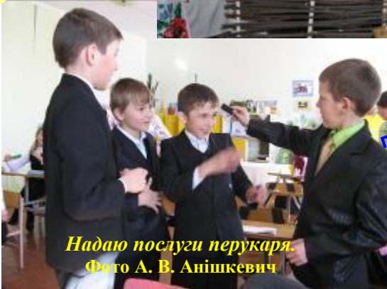
Надаю послуги перукаря.