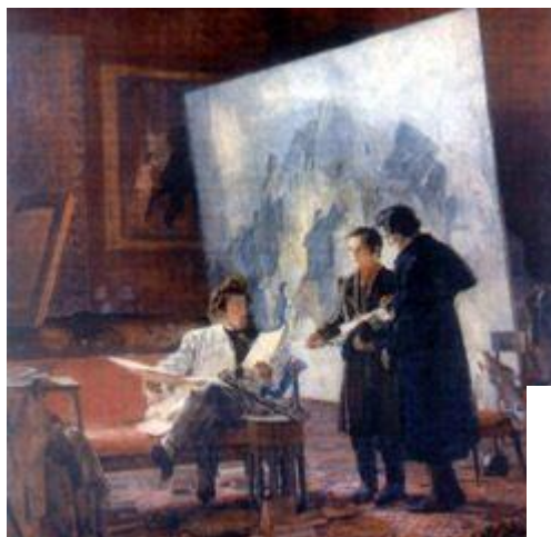
Молодий Тарас Шевченко у К. Брюллова, 1947р. Г. Меліхов