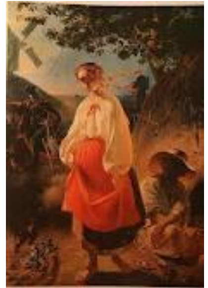
Катерина, 1842 р. Т. Г. Шевченко