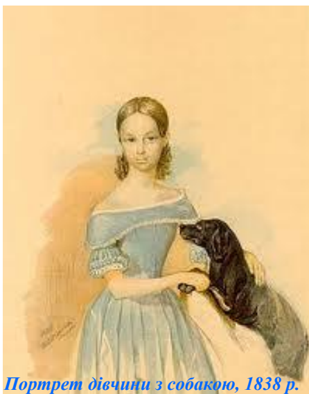
Портрет дівчини з собакою, 1838 р. Т. Г. Шевченко