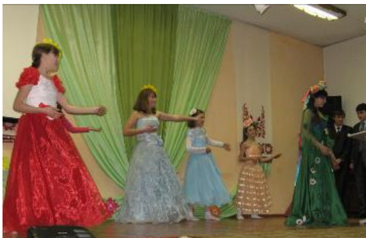
Хлопці 11-А класу