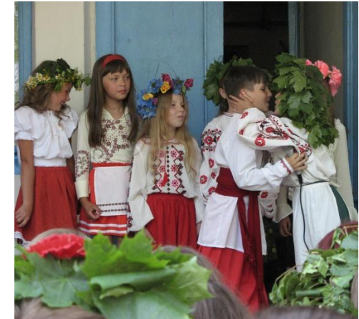
Свято «Водіння Куста»