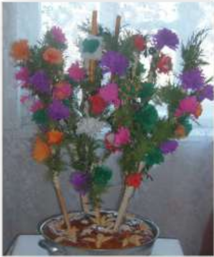
Назва роботи: «Весілля у Сварицевичах» Автор: Н.Полюхович