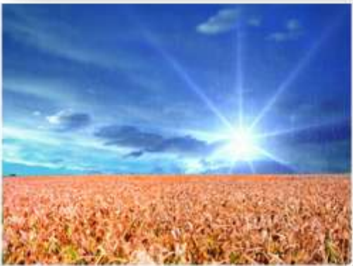
Назва роботи: «Його величність годувальник хліб» Автор: О.Яцута