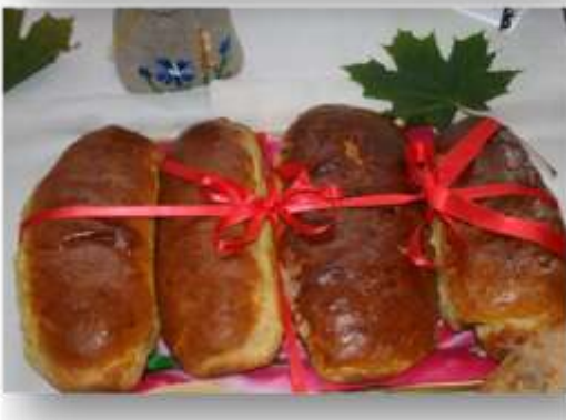
Назва роботи: «Хліб в обрядах і звичаях с.Сварицевичі» Автор: Г.Крупко