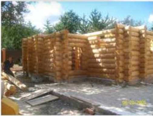
Назва: «Ремесла і промисли» Автори: М.Галушко, Г.Турук