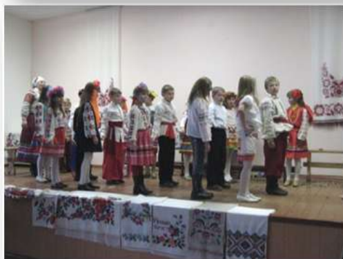
Назва: «Українські вечорниці» Автор: Л.Холодько