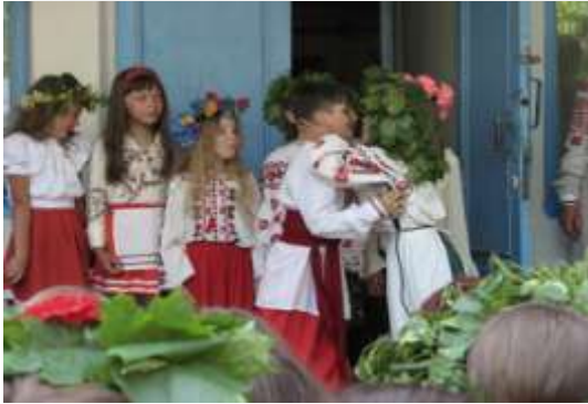
Назва: «Пісенна творчість мого краю» Автори: Т.Кузло Полюхович О.А.