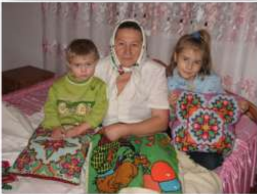
Назва: «Майстрині вишивальниці» Автор: Л. Галушко