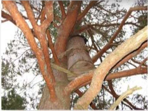
Назва роботи: «Медовими стежками» Автор: А.Анішкевич