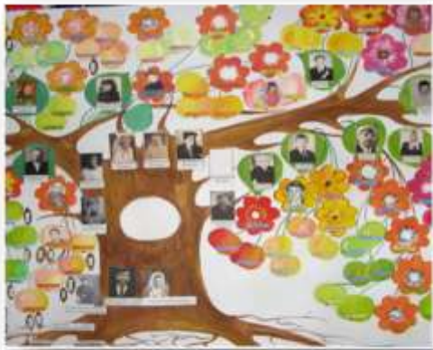
Назва роботи: «Стежками моєї родини» Автор: О.Яцута, О.Полешко