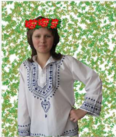
Назва роботи: «Свята весняного календарного циклу на українському Поліссі» Автор: В.Грицюк