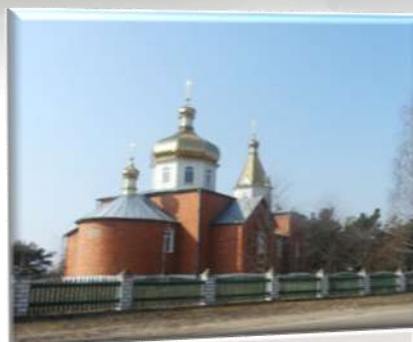
Назва роботи: «Історія духовного храму» Автор: В.Грицюк