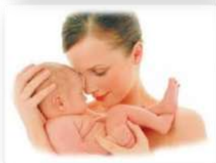
Назва: «Обряди і звичаї, пов'язані з народженням дитини» Автор: Г.Киркевич