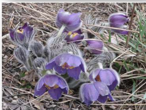
Назва: «Сон-трава» Автор: Г.Крупко