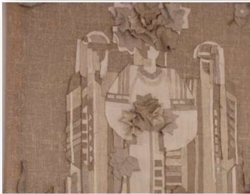
Назва роботи: «Водіння Куста в Сварицевичах» Автор: