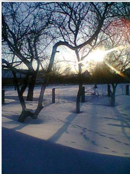
Назва роботи: «Цикл зимових календарних свят» Автор: В.Грицюк