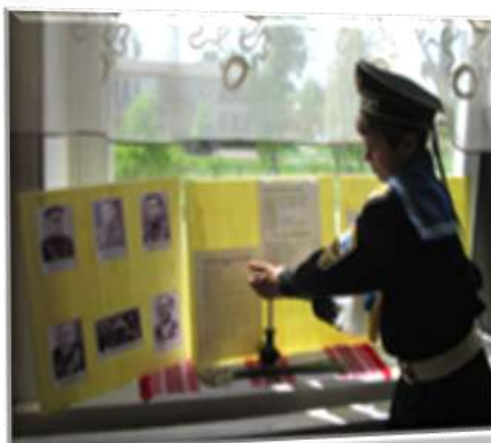
Назва роботи: «Шляхами подвигу і слави» Автор: О.Полешко