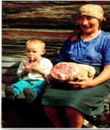
Назва: «Оригінальний витвір сварицевицької кухні» Автор: В.Грицюк