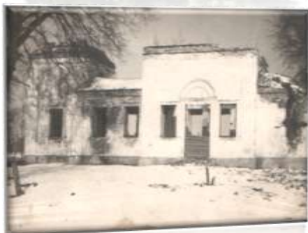
Назва роботи: «Історія рідного краю» Автор: О.Полешко