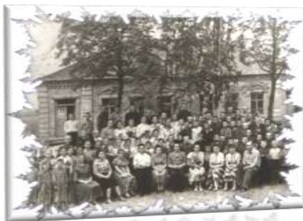
Назва роботи: «Історія школи» Автор: О.Полешко