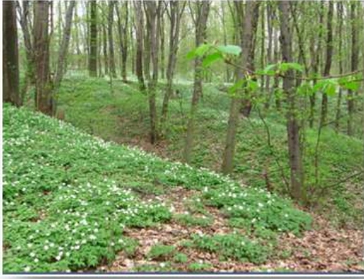
Назва: «Червона книга Сварищевич» Автор: Г.Крупко